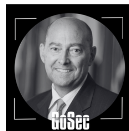
Admiral James Stavridis Vice-Président, Affaires Mondiales, à The Carlyle Group