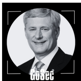
Le Très Honorable Stephen Joseph Harper Fondateur et Président de Vision One

DEPUIS 2003, GOSSEC S'ENGAGE À PRÉSENTER LES ACTEURS LES PLUS INFLUENTS DANS LE DOMAINE DE LA CYBERSÉCURITÉ :