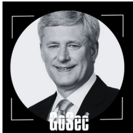
Le Très Honorable Stephen Joseph Harper Fondateur et Président de Vision One

DEPUIS 2003, GOSEC S'ENGAGE À PRÉSENTER LES ACTEURS LES PLUS INFLUENTS DANS LE DOMAINE DE LA CYBERSÉCURITÉ :